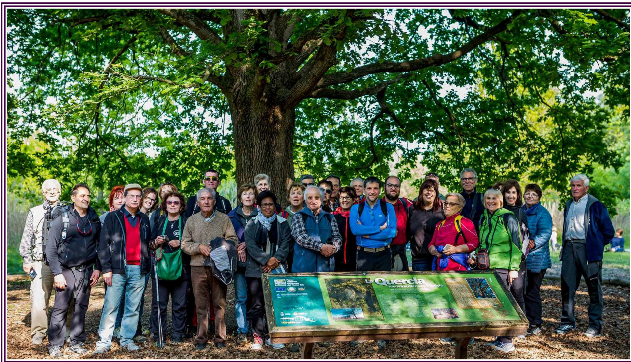
I soci in gita alle sorgenti del Sile – Casacorba (TV) – 23/04/2017