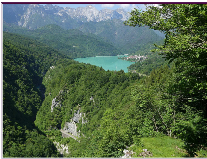
Forra del torrente Cellina e sovrastante Lago di Barcis