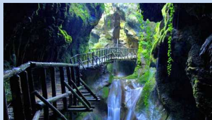
Camminamenti all'interno della forra del Caglieron