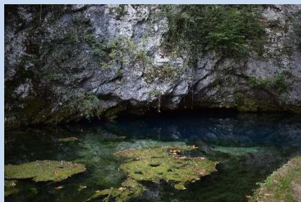
Sorgente del Gorgazzo