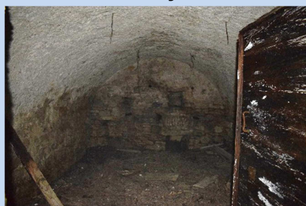
Particolare volta a botte di una Speloncia